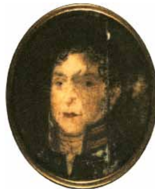
Jaakko Juteini 1781–1855

15.45 – 16.30 ”Laulu Suomessa”, elokuva Jaakko Juteinista (45 min)